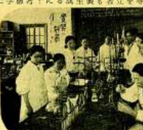
女子美術の衛生化学実習

明治六年、大学東校に製造日専門学校に類するものが設立された。日本におきましては、この大学の設立が、日本の教育の歴史に重要な一頁を記した。この時の子供は、本朝三百年の教育の歴史に重要な一頁を記した。