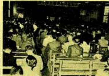
第七回全国学 館山で盛大に開く

第七回全国学 館山で盛大に開く 第七回全国学 館山で盛大に開く 第七回全国学 館山で盛大に開く