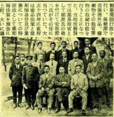
製薬協会の役員写真